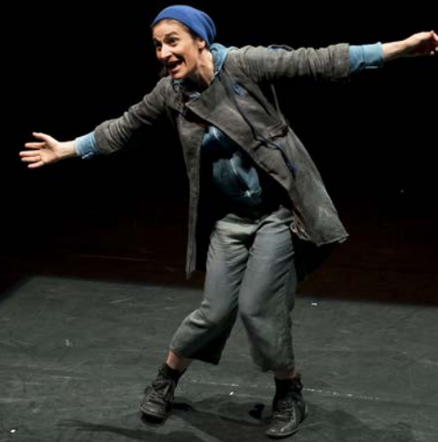
FESTIVAL LE BAZAR DES MÔMES