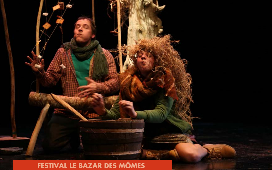
FESTIVAL LE BAZAR DES MÔMES