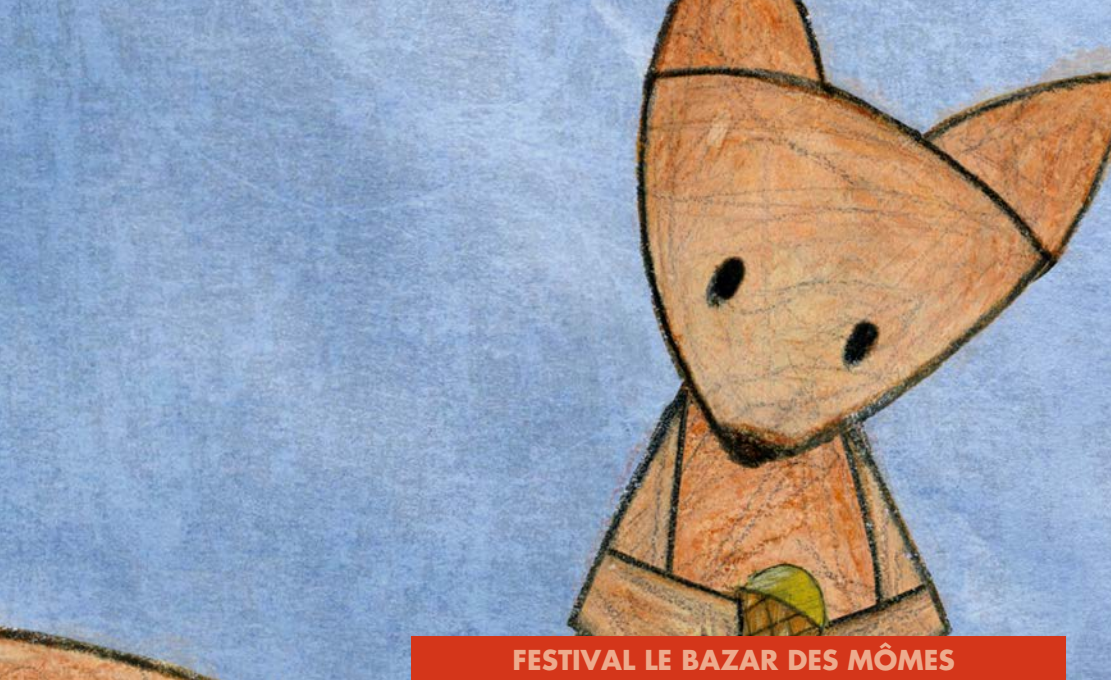
FESTIVAL LE BAZAR DES MÔMES