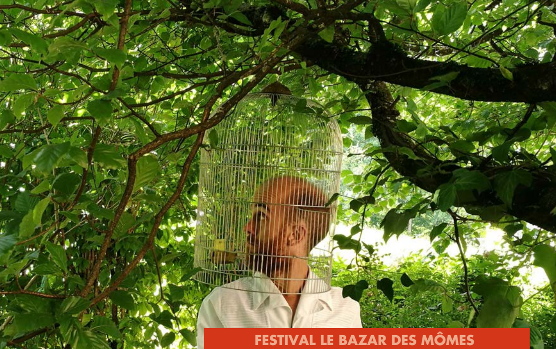
FESTIVAL LE BAZAR DES MÔMES