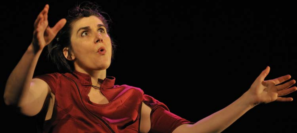
FESTIVAL LE BAZAR DES MÔMES