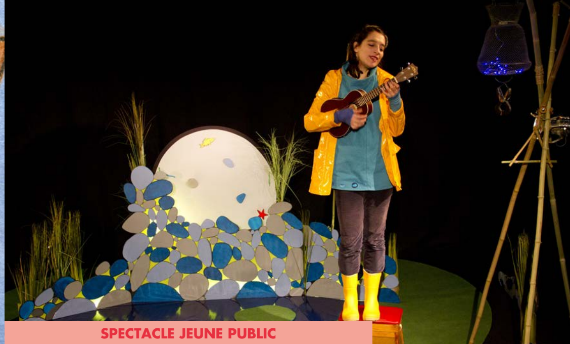
SPECTACLE JEUNE PUBLIC